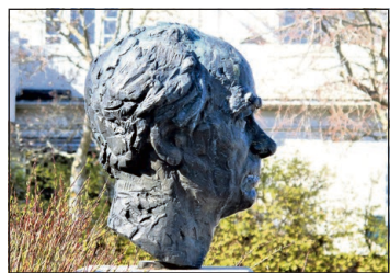
PÅ TORVET: Her er Nils Aas sitt portrett av Trygve Bratteli på Teie torv.

- Trygve Bratteli (1910-1984) var etter mitt syn en undervurdert arbeiderpartipolitiker. Han var fra 1945 og i 20 år nestfor-