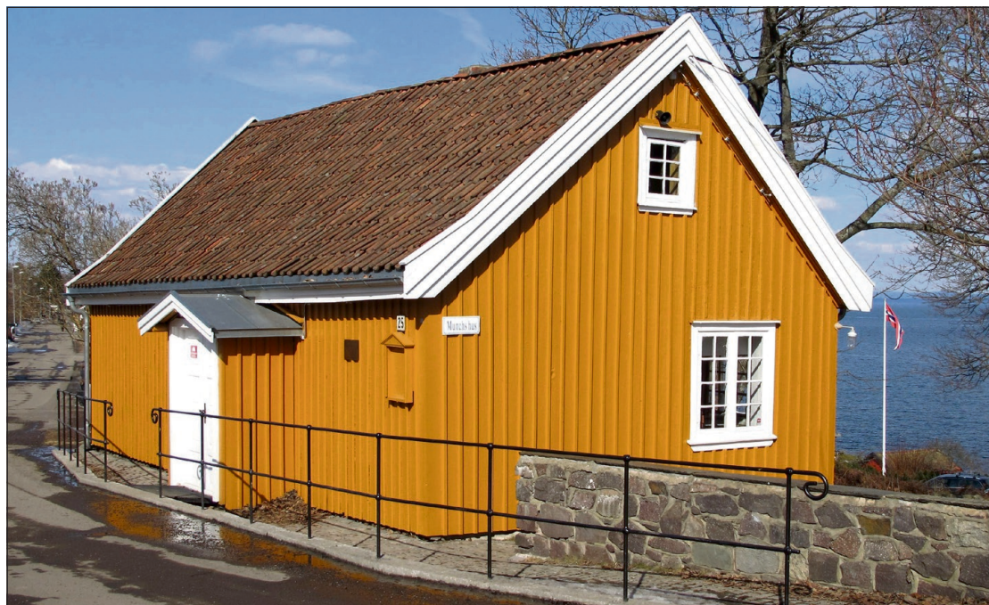
UTGANGSPUNKTET: Her er huset som er bakgrunn og fundament for utstillingen Munchs hus 2018, som åpner på Haugar lørdag.